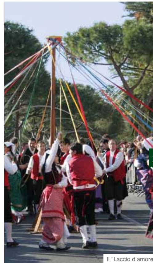
Il "Laccio d'amore"

Posta com'è su un colle, Penna Sant'Andrea regala una vista magnifica e completa sulla Valle del Vomano. Per quanti amano la natura, l'appuntamento è con una passeggiata nella riserva naturale regionale di Castel Cerreto . Il borgo deve la sua fama al " Laccio d'amore ", un'antica danza popolare eseguita nelle feste e soprattutto nei matrimoni, al fine di propiziarne il buon esito. Agli inizi del '900 si è costituito il gruppo folkloristico omonimo, che ha reso famosa la danza in tutto il mondo.