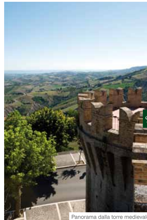
Panorama dalla torre medievale

la cultura contadina rivivono nella gastronomia, che annovera quale piatto tipico i " Cingoli al sugo di papera ".